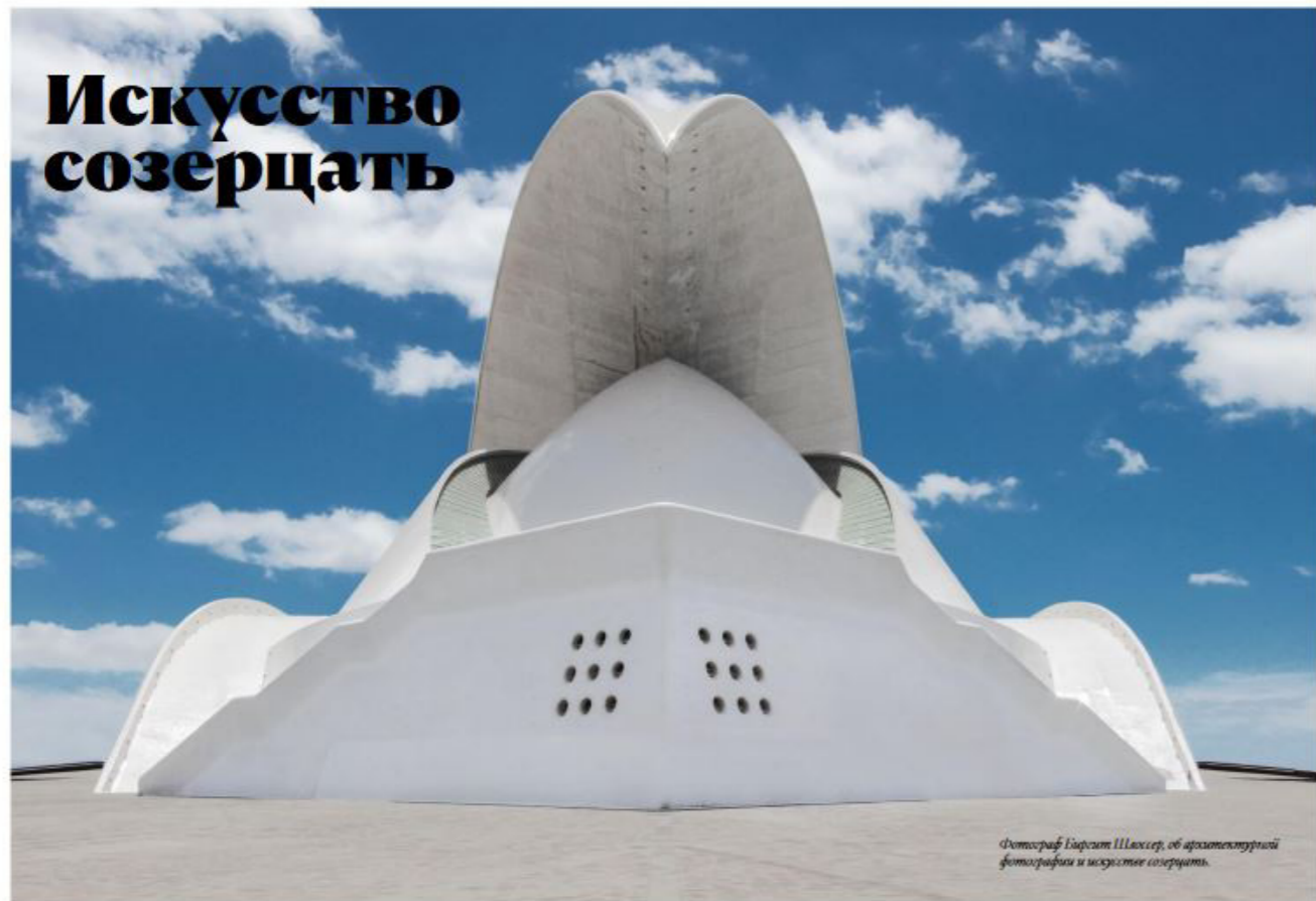
Фотограф Гарретт Шварц, об архитектурной фотографии и искусстве созерцать.

Архитектурная фотография — мой текущий профиль. Особенно сфокусирована на современной архитектуре. Больше преимуществ для архитектурной фотографии состоит в том, что объект не может убежать. Здесь нет дилеммы: мимолетный пейзаж, дождливый вечер или идеальное время суток и идеальное освещение, как и пейзажной фотографии. Конечно, свет или погодные условия и время суток также играют роль в архитектурной фотографии, но в отличие от пейзажной и планирование расписания своего тура мне по силам. И можно независимо от желаемых тем выбрать время на поиски идеальной перспективы или детали кадра. Я люблю это расслабленное и медитативное.